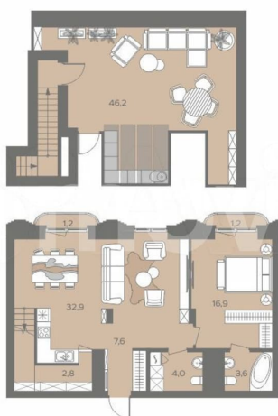
ЭПОХА Петропавловская, 14