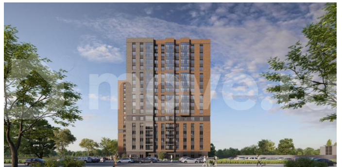
Секция 1 Квартира 1С (3-6 этажи, 7-16 этажи)