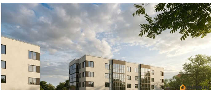
Подъезд 3. Этаж 2-4