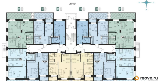
Подъезд 2. Этаж 1