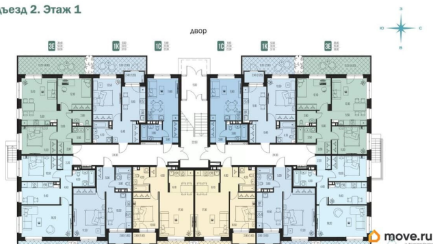
Подъезд 2. Этаж 1

указана квартира 000, S=22,3 м2, цена 0 000 000 ?