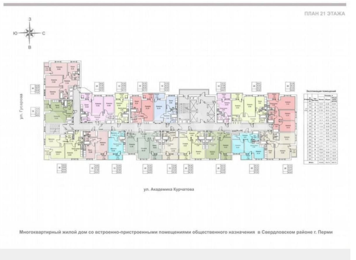
План квартиры № 348 на 21 этаже