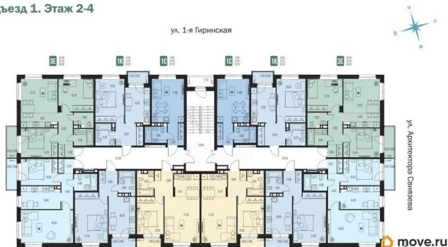
Подъезд 1. Этаж 2-4

Подробности акции уточняйте в офисе продаж застройщика. Рекламодатель может изменить сроки и условия акции. Не является публичной офертой.**Реклама. Застройщик ООО СЗ «КЕЛШ», ИНН 5902050200. Проектная декларация на сайте наш.дом.рф. В рекламе указана квартира 000, S=22,3 м2, цена 0 000 000 ?