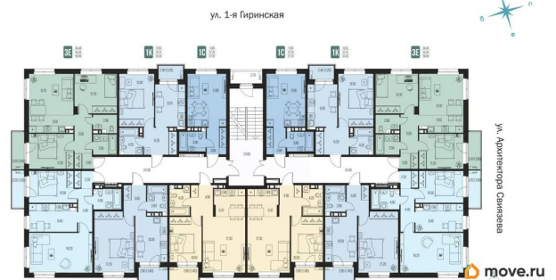
Подъезд 1. Этаж 2-4