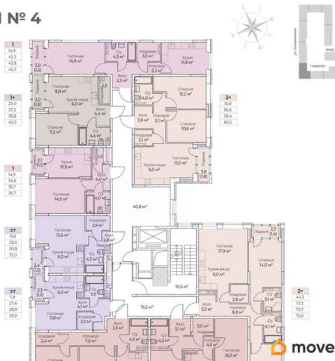
СЕКЦИЯ № 4 2 ЭТАЖ