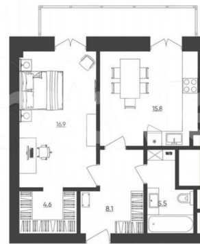
ПРИМЕР ПЛАНИРОВОЧНОГО РЕШЕНИЯ

*Подразумевается ориентация на место расположения окон, отмечены в проекте подвала и по территории в кв. 192/191