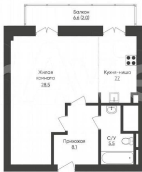
ФАКТИЧЕСКАЯ ПЛАНИРОВКА КВАРТИРЫ

*Подразумевается ориентация на место расположения окон, отмечены в проекте подвала и по территории в кв. 192/191