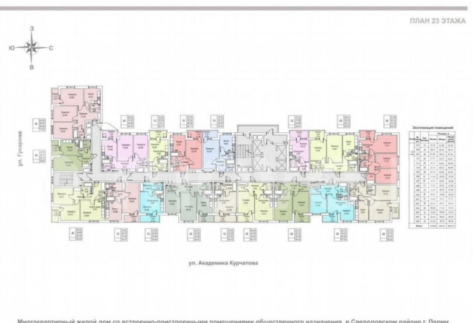
Многоквартирный жилой дом со встроенно-пристроенными помещениями общественного назначения в Свердловском районе г. Перми