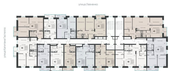
План 3-8 этажей