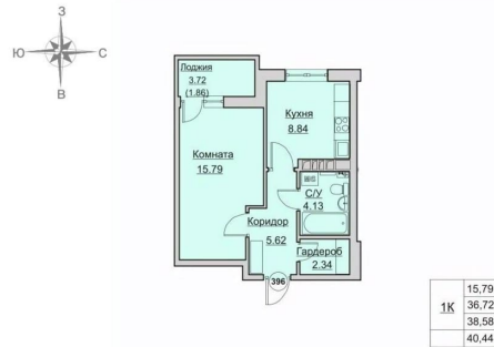
План квартиры № 396 на 23 этаже