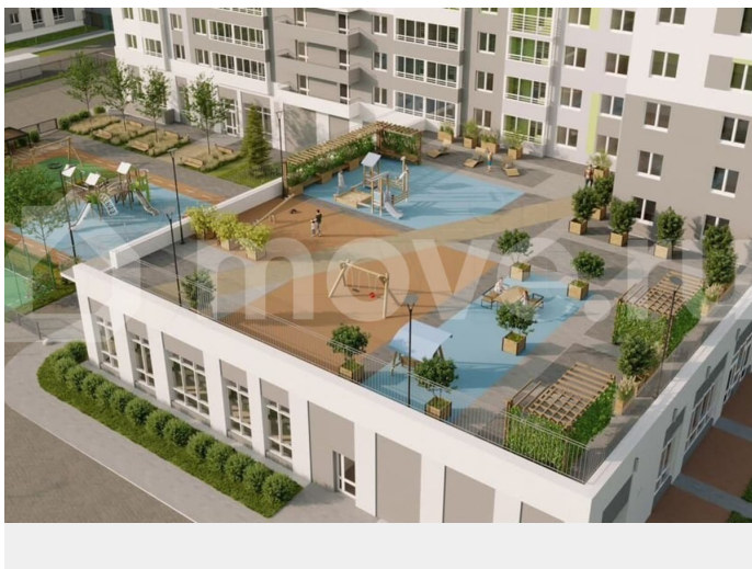
Многоквартирный жилой дом со встроенно-пристроенными помещениями общественного назначения в Свердловском районе г. Перми