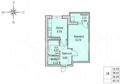
План квартиры № 215 на 13 этаже