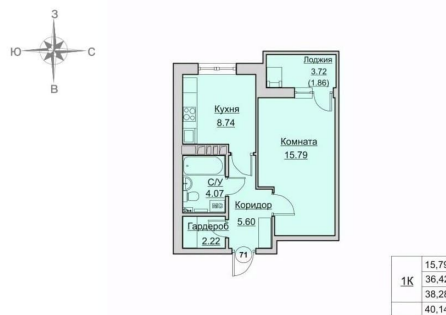
План квартиры № 71 на 5 этаже