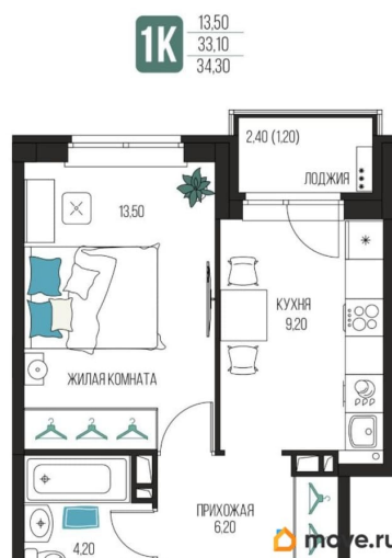
Подъезд 3. Этаж 2-4